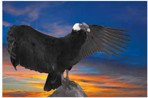
Fig. 4. Andean condor ( Vultur gryphus ) against sunset sky background. Photo taken on: March 03rd, 2012.

Conforme a la información brindada por el Ministerio del Ambiente del Ecuador la vicuña como especie endémica se encuentra ligada a las culturas andinas hasta su desaparición debido a la conquista española, para la recuperación de esta especie se firmó un convenio con países andinos vecinos con el fin de la conservación y manejo de la vicuña. El páramo del Chimborazo posee las mejores condiciones climáticas y ecológicas para la reintroducción de esta especie que inició mediante donaciones dentro del marco del acuerdo firmado. Las donaciones fueron por parte de países vecinos andinos como son Chile, Perú y Bolivia sumando un total de 277 ejemplares que a la fecha del último estudio poblacional realizado en el mes de julio de 2012 existe un total de 4824 ejemplares, siendo un éxito la reinserción de esta especie endémica del lugar.