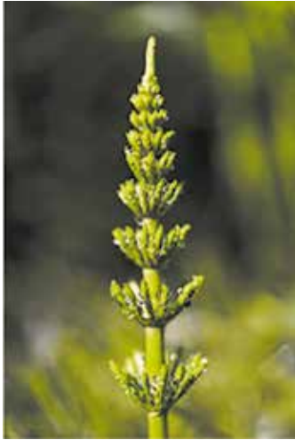
Fig. 3. Equisetum arvense The morning dew, nature. Photo taken on: May 09th, 2015.

Dentro de la flora de tipo herbácea podemos resaltar a la cola de caballo ( Equisetum arvense ) que posee propiedades hepatoprotectoras por la escisión del metanol (MeOH) resultando en aislamiento de dos resinas fenólicas ( Phenolic petrosins ) y cuatro flavonoides, de los cuales es necesario dar mención al phenolic petrosin Onitin y al flavonoide Luteolin ya que estos muestran la característica de hepatoprotección en la actividad citotóxica generada por la tacrina en células hepáticas G2. El análisis EC 50 (concentración media efectiva) que se emplea comúnmente para determinar concentraciones de toxinas o drogas que causan un efecto en el cuerpo, arrojó un resultado positivo para el uso de esta planta para el tratamiento de la hepatitis en la medicina oriental tradicional 7 . (Fig.3)