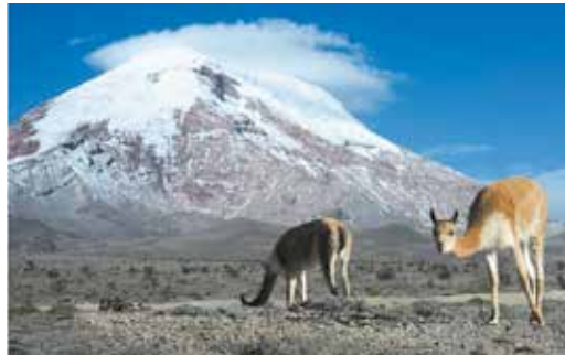
Fig. 1. Vicuña ( Vicugna vicugna ) or vicugna is wild South American camelid, which live in the high alpine areas of the Andes. It is a relative of the llama. It is understood that the Inca valued vicuñas for their wool. The vicuña is the national animal of Ecuador, Peru and Bolivia. The photo was taken on the road through the Andes near the inactive stratovolcano Chimborazo, in the Cordillera Occidental of the Andes. Photo taken on: August 06th, 2012

Para la conmemoración de los 280 años de la primera misión geodésica al volcán, la cual consistió en una delegación de científicos de la Academia de Ciencias de París que tenían como objetivo completar datos para determinar la forma de la Tierra 9 , se organizó un ascenso a la cumbre del Chimborazo donde se realizó la medición mediante el sistema global de navegación por satélite siendo sus siglas en inglés GNSS en la cual se logró determinar que este volcán es el punto más alejado del centro de la Tierra con un radio de 6384,4 kilómetros y con una precisión de más - menos tres metros, siendo este valor mayor a los registrados por el volcán Huascarán de Perú y el Monte Everest de Nepal adjudicándose el título del pico más alto con respecto al centro de la Tierra 2 . (Fig. 2)