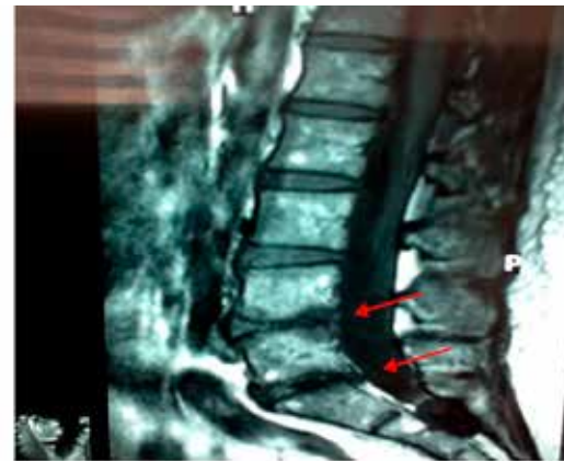
Figura 5: MRI pre tratamiento caso 3