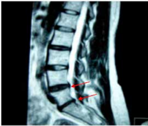
Figura 1: MRI pre tratamiento caso 1