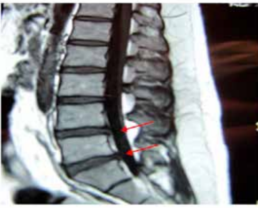
Figura 4: MRI post tratamiento caso 2