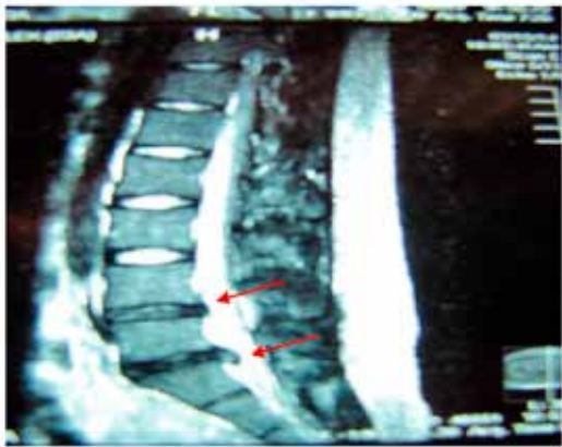
Figura 3: MRI pre tratamiento caso 2