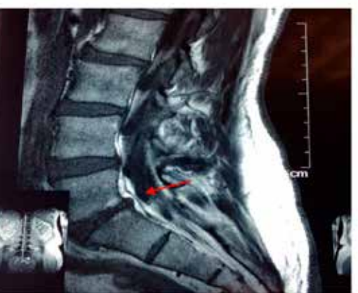
Figura 8: MRI post tratamiento caso 4