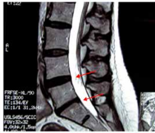
Figura 2: MRI post tratamiento caso 1