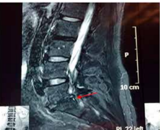
Figura 7: MRI pre tratamiento caso 4