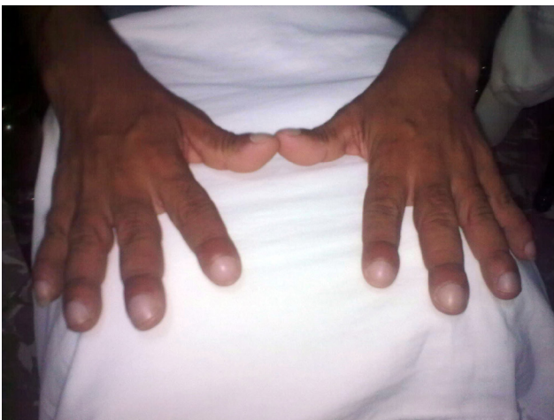
Figura 2. Uñas gruesas en vidrio de reloj, aumento de tamaño de los dedos de las manos y aumento cilíndrico notable de los dedos de las manos.

En la piel de los pies y las manos, presentaba una hiperqueratosis moderada, conocida como la queratodermia palmo-plantar, (figura 2)