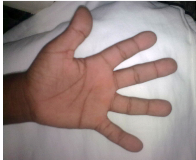
Figura 5. Aumento de tamaño de la mano y aspecto cilíndrico de los dedos.